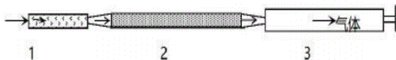
1——检测管；2——后处理管；3——采样器。

根据现场情况选择合适的检测管及配套的后处理管，割断检测管和配套的后处理管两端封口，与配套的采样器连接。采样装置连接示意图见图C.2。